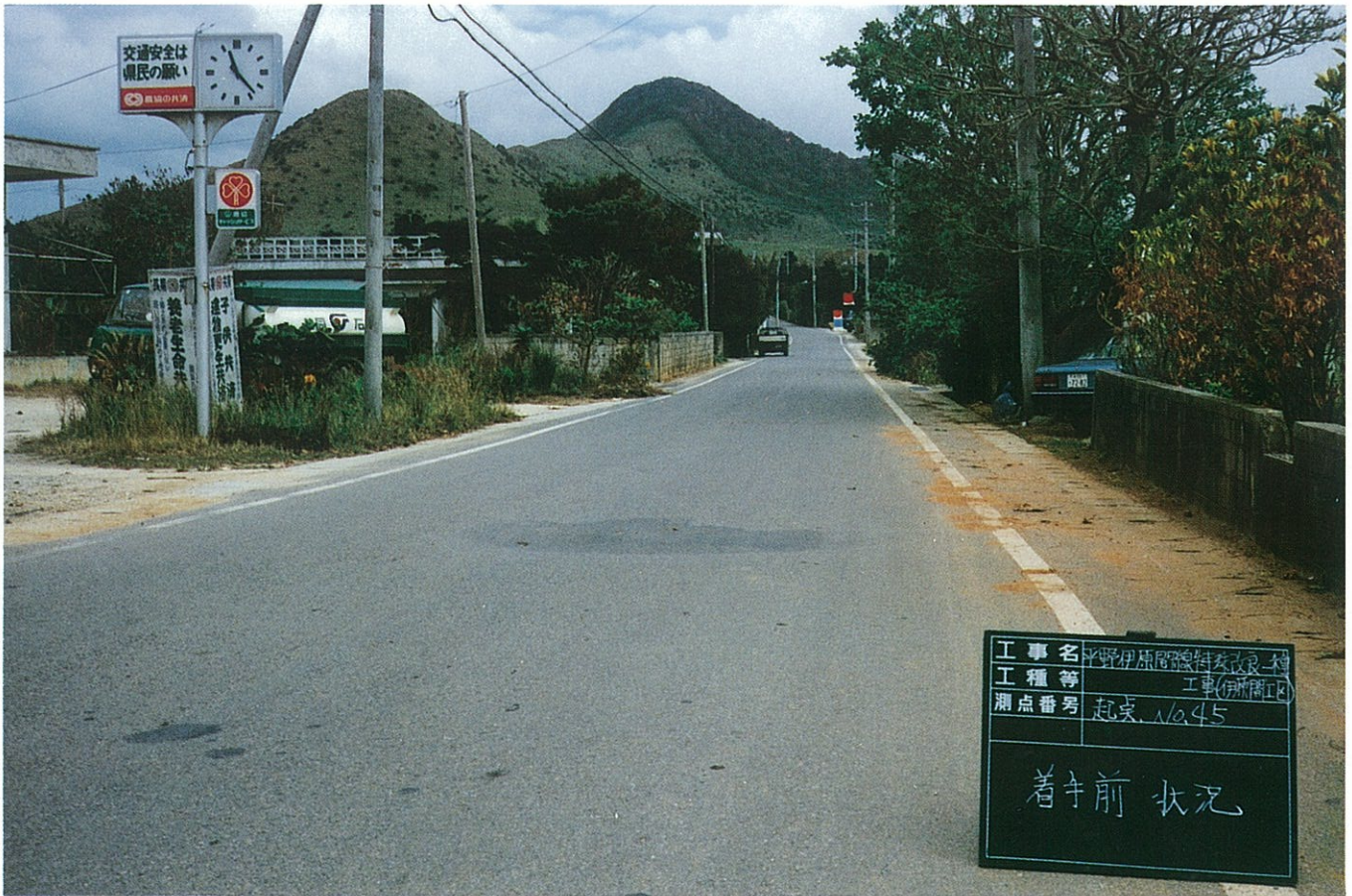
石垣市伊原間付近