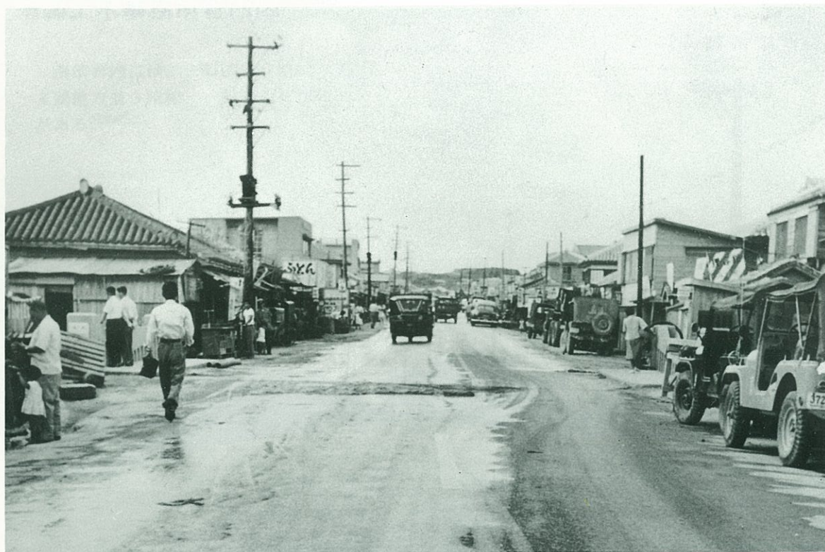
ひめゆり通り(姫百合橋付近)の新旧の風景