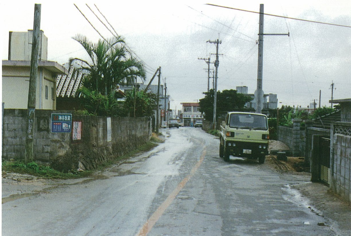
糸満市喜屋武付近