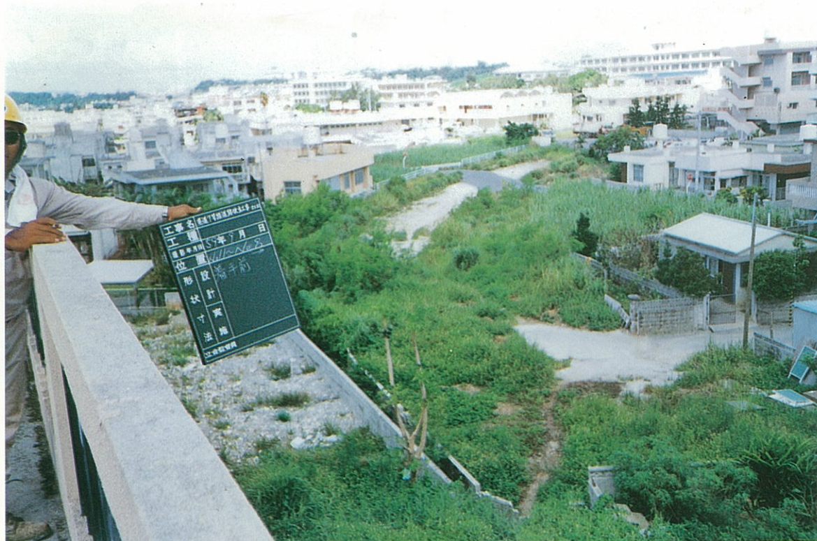
豊見城村上田交差点付近