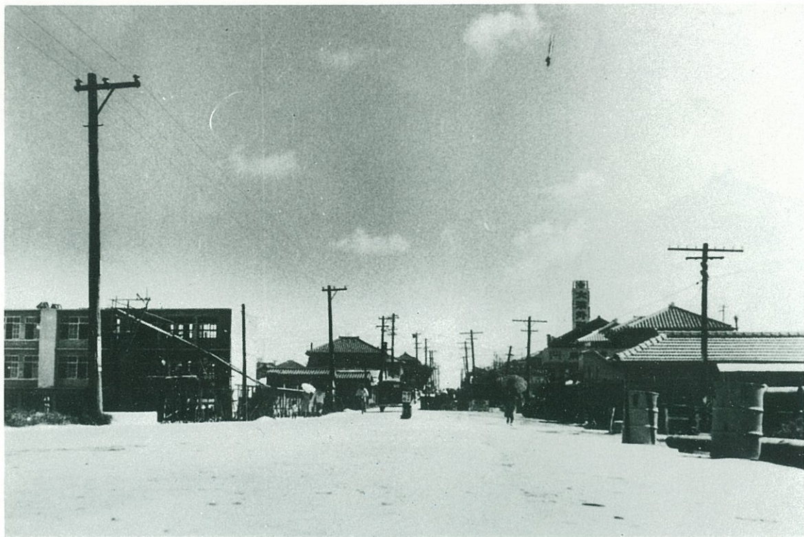
神原小学校付近の新旧の風景