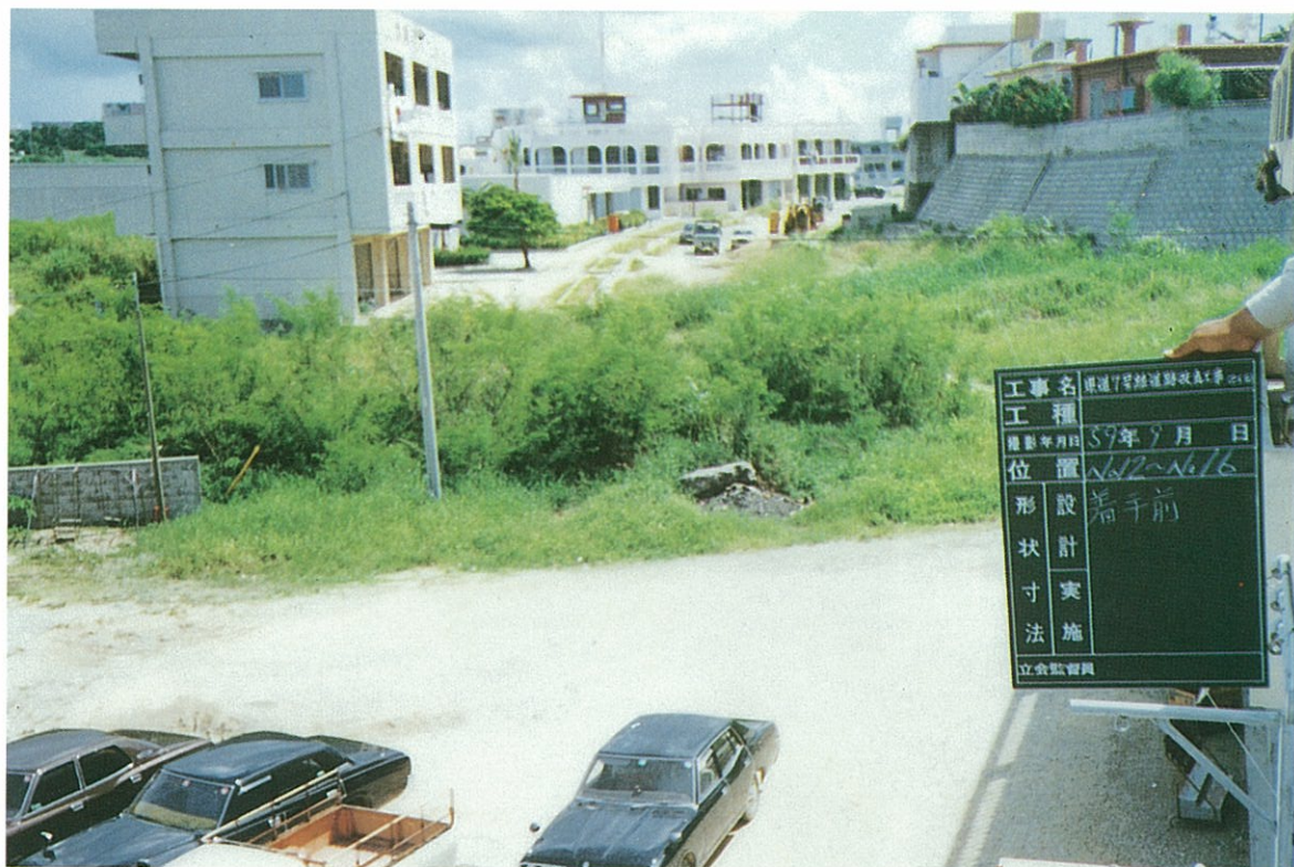
豊見城村上田交差点付近