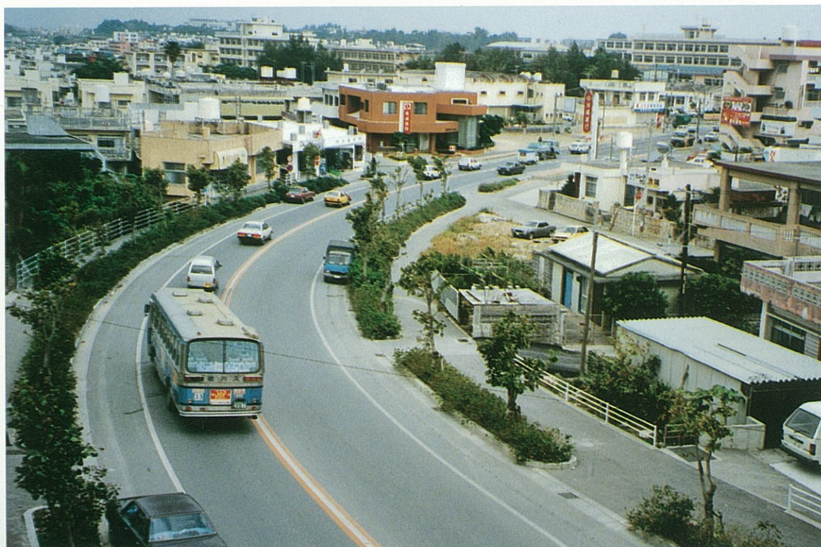
7号線バイパスが完成すると豊見城団地方面からの交通渋滞が緩和されるものと期待される。昭和62年