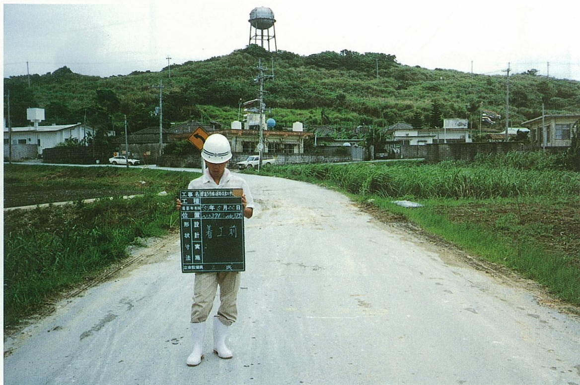
玉城村喜良原付近