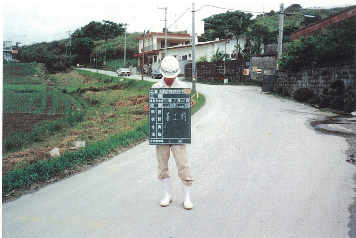
玉城村喜良原付近