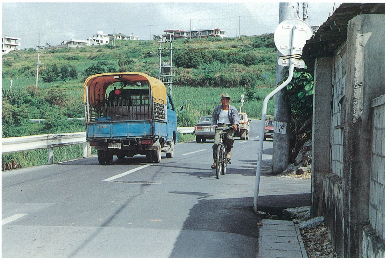
具志川市高江洲付近