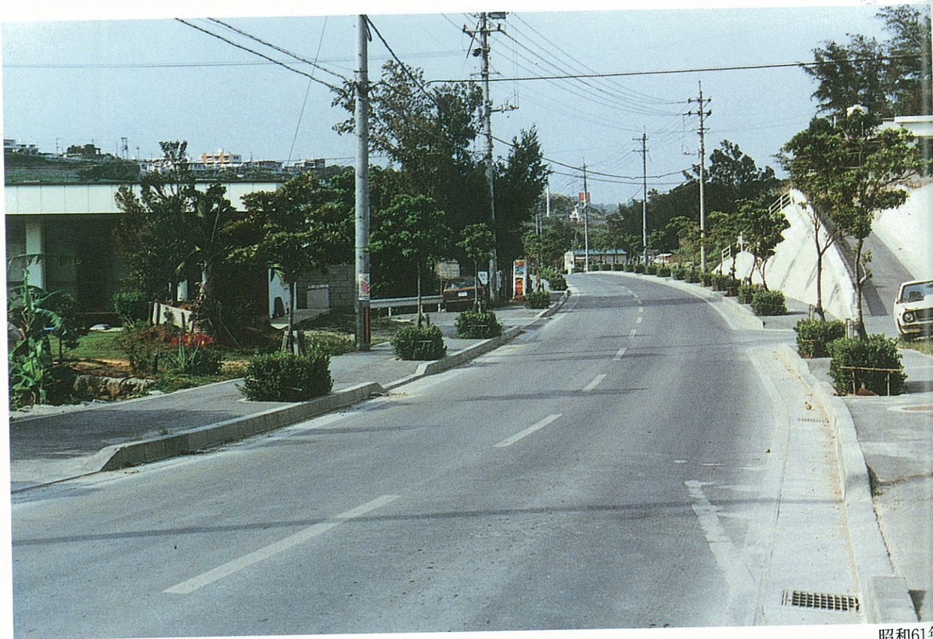
中城村北上原付近