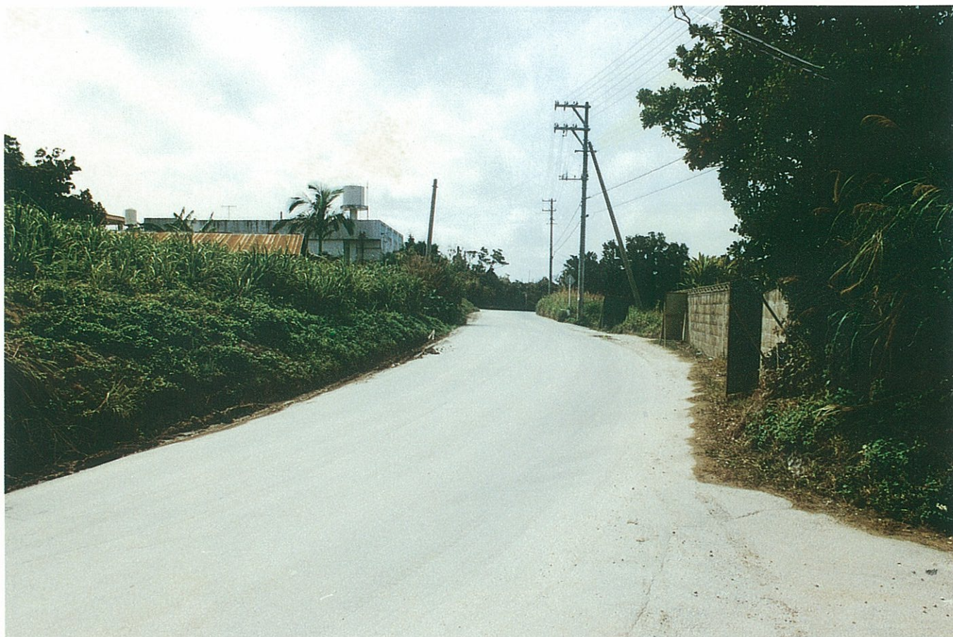
中城村北上原付近