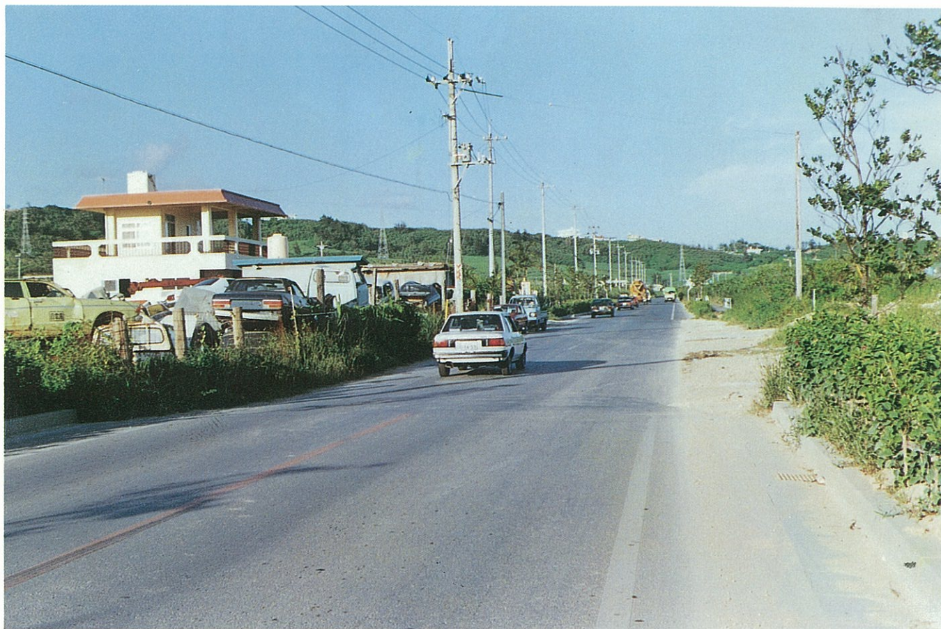
具志川市豊原付近