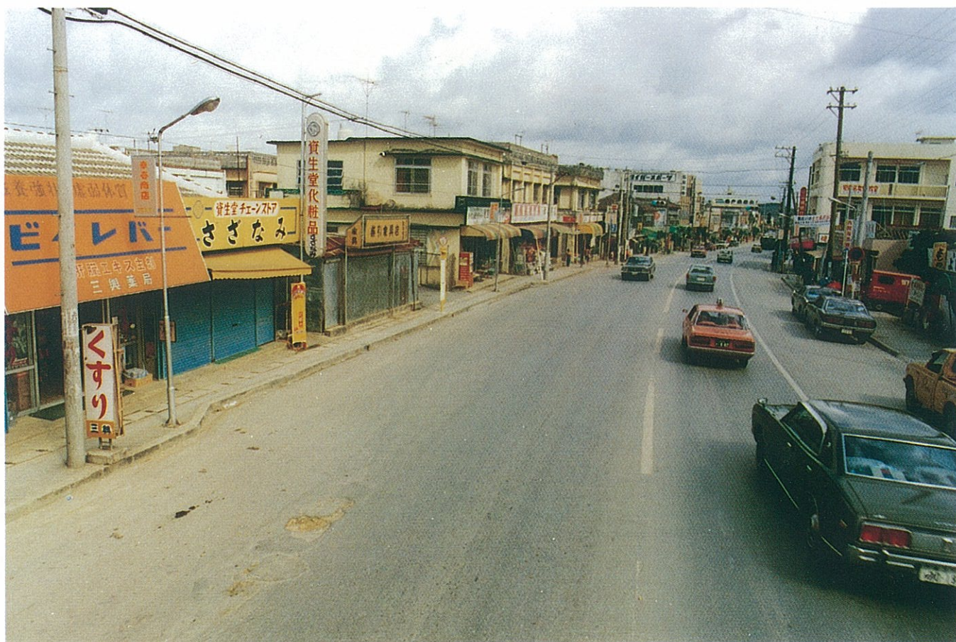
具志川市安慶名付近