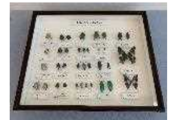
③標本イメージ（世界の昆虫）