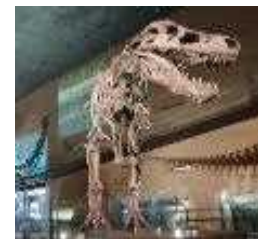
①展示イメージ（恐竜の化石）