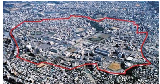
那覇新都心地区(那覇市)

那覇新都心地区は、昭和52年から昭和62年にかけて返還された牧港住宅施設跡地及び周辺既存市街地からなる総面積214haの地区です。平成4年度に事業に着手し、平成17年度に事業を完了しており、「申し出換地」により大街区を形成し大型商業施設を立地する等計画的な街づくりが行われました。現在では、県都那覇市を代表する商業・業務・行政の各種中枢機能を新たに立地するなど活況を呈しており、魅力的で活力のある街が形成されています。