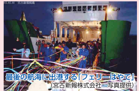
最後の航海に出港する「フェリーはやて」