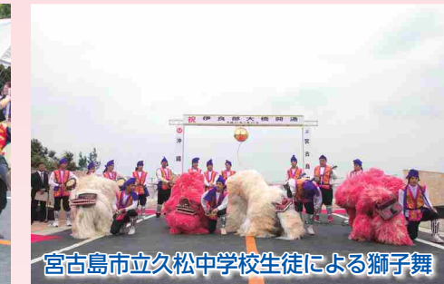
宮古島市立久松中学校生徒による獅子舞