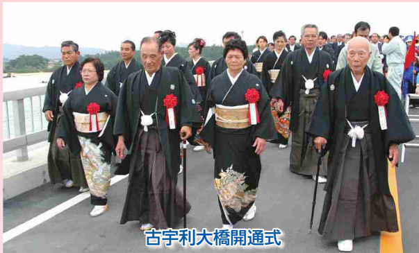
古宇利大橋開通式