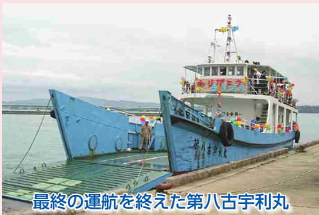
最終の運航を終えた第八古宇利丸