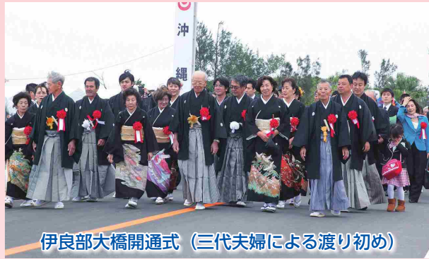
伊良部大橋開通式 (三代夫婦による渡り初め)