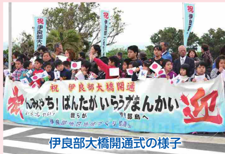
伊良部大橋開通式の様子