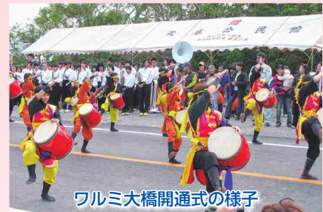
ワルミ大橋開通式の様子