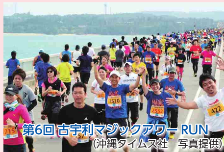
第6回 古宇利マシクアワー RUN