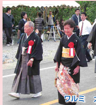
ワルミ大橋開通式