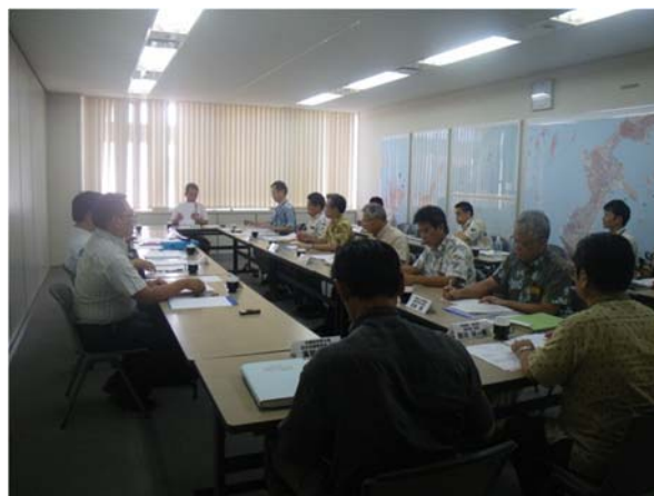
写真 検討委員会の状況(第1回)