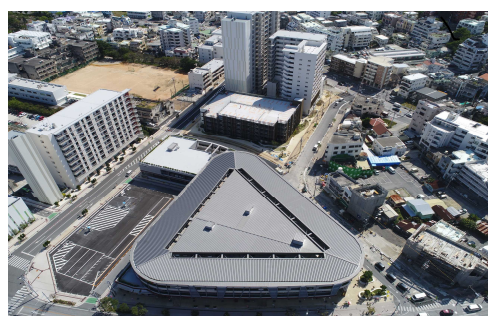
農連市場地区防災街区整備事業