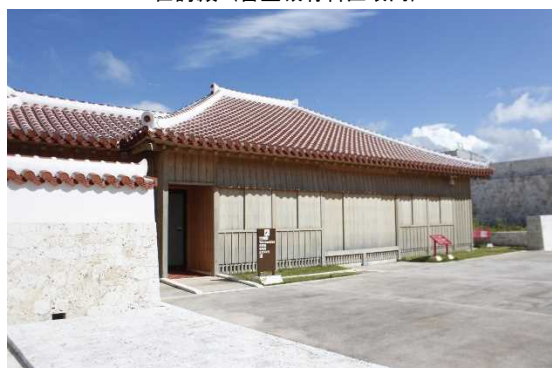
世誇殿（首里城有料区域内）