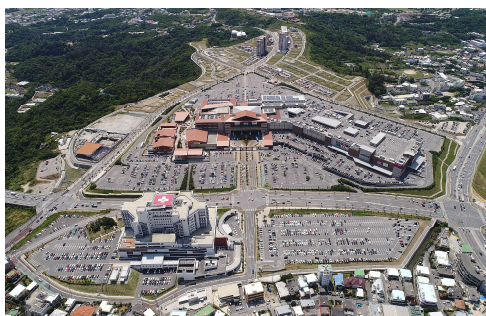
アワセ地区土地区画整理事業

本県の市街地再開発事業は、令和 4 年度末現在で、都市局所管の 7 地区、住宅局所管の 1 地区が完了している。