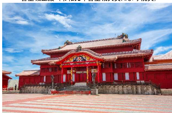
首里城正殿（令和元年首里城火災により焼失）