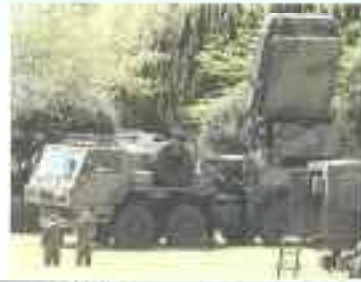
射撃レーダー装置