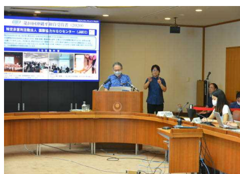
知事定例記者会見

知事が必要と認めるとき又は県政記者クラブから申し入れがあったときは、臨時記者会見を行います。臨時記者会見には、記者会見室を用いる場合と知事が移動時に記者からインタビューを受けるぶら下がり会見があります。