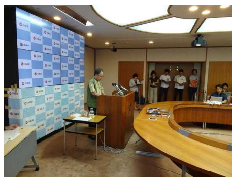
知事定例記者会見

知事が必要と認めるとき又は県政記者クラブから申し入れがあったときは、臨時記者会見を行います。臨時記者会見には、記者会見室を用いる場合と知事が移動時に記者からインタビューを受けるぶら下がり会見があります。