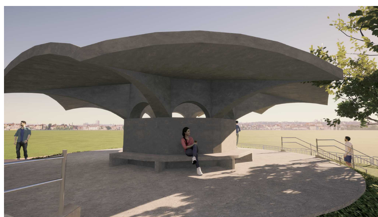
深い軒が影を生み出し、落ち着いた空間となる