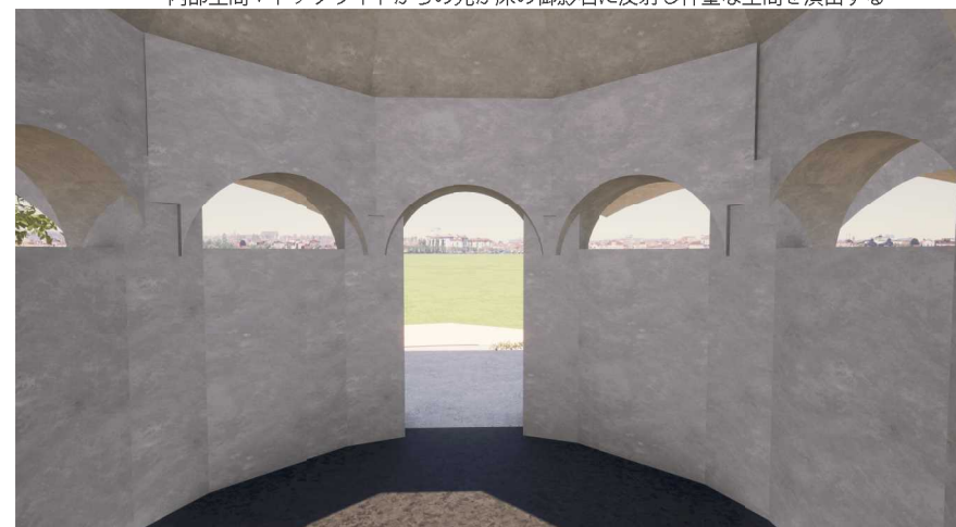
アーチ型の開口とし壕に入るかのような感覚をもたせることで