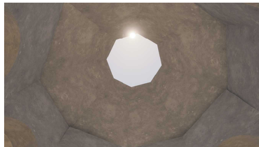
展望施設内部からトップライトを見上げる