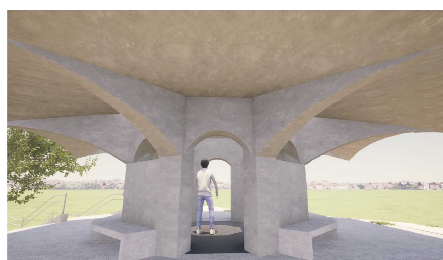
内部空間：トップライトからの光が床の御影石に反射し神聖な空間を演出する