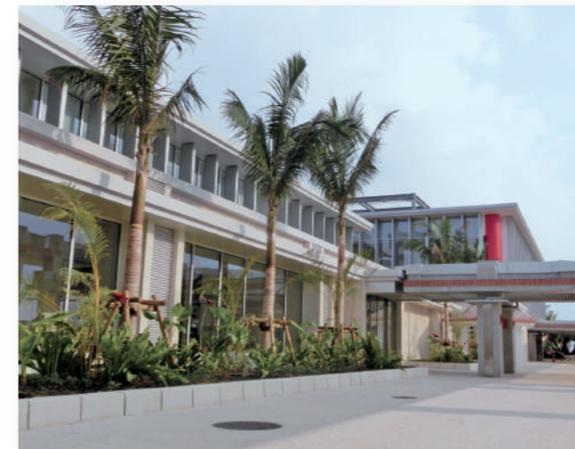
▲国内線ターミナルビル