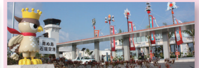
▲空港のマスコットキャラクター「ぱいぐる」