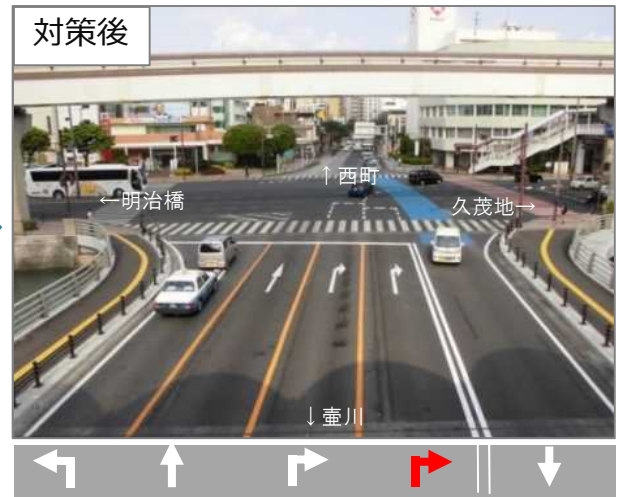
国道330号から久茂地方面への右折を2車線化