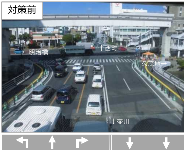
国道330号の直進及び右折が渋滞