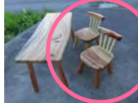
園児用椅子（年長向）