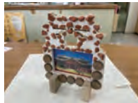
首里城フレームキット