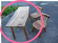
園児用長テーブル