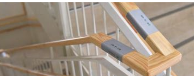
リュウキュウマツの手すり

地域の木材を存分に使った庁舎は、木の 温もりと香りが広がる素敵な空間となっ ています。