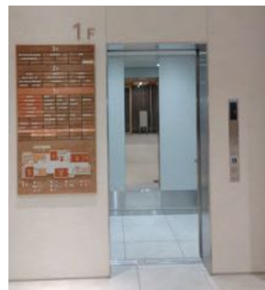
エレベーターの横に木製の案内板