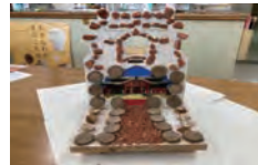
首里城貯金箱キット