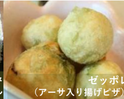
ゼッポレ(アーサ入り揚げピザ)