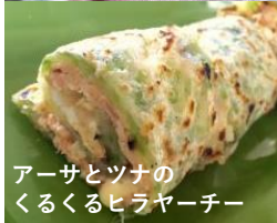
アーサとツナのくるくるヒラヤーチー