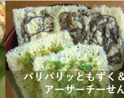
パリパリッともずく&アーサーチーせん