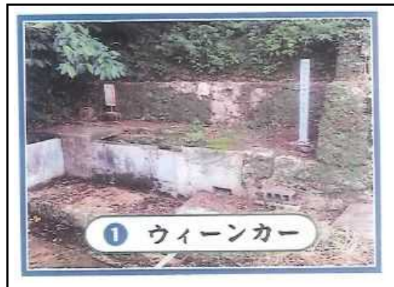
(カー(井泉)①：ウィーンカー) 施工後

※16枚程度の写真を抜粋して、解説を記入してください。その他の写真はデータで提供願います。