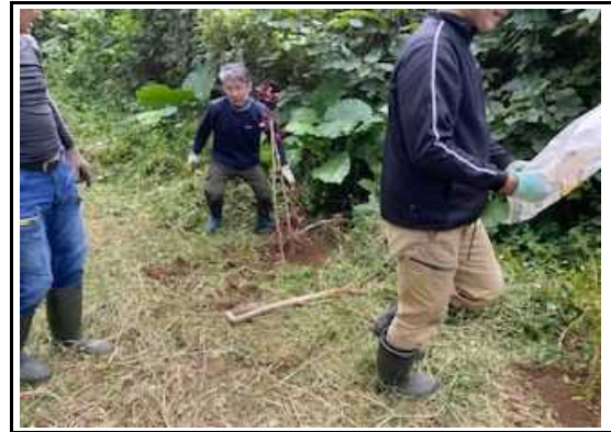
(美化活動 花いっぱい苗植え) 6