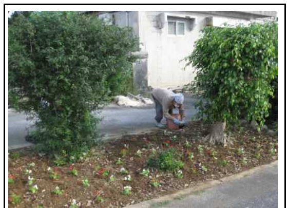
(苗花の植え付：公民館付近)

※16枚程度の写真を抜粋して、解説を記入してください。その他の写真はデータで提供願います。