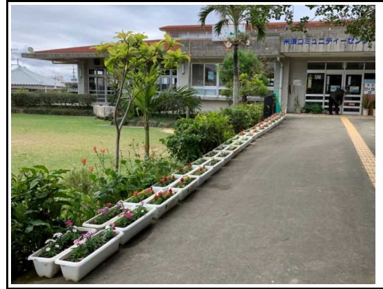
(苗花植え付け：公民館)