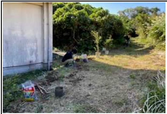
(美化活動 花いっぱい苗植え) 7