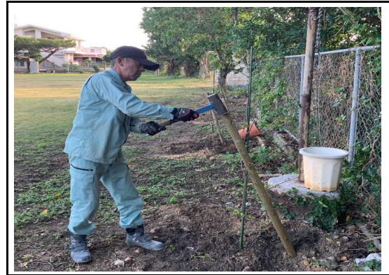
(花木の植栽：米須青年会館)