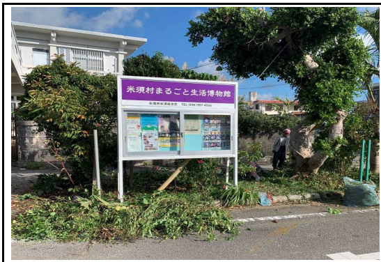
(美化作業：公民館付近)