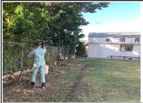
(花木の植栽：米須青年会館)