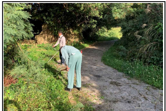
(美化活動：米須城付近)