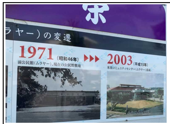
(看板設置：写真パネル)

※16枚程度の写真を抜粋して、解説を記入してください。その他の写真はデータで提供願います。