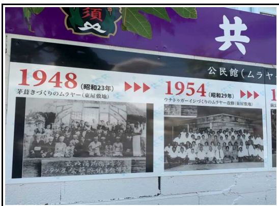
(看板設置：写真パネル)