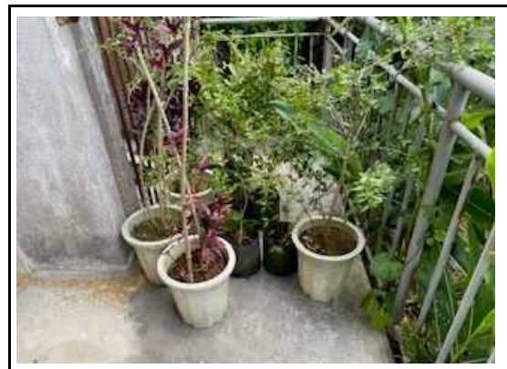
(美化活動 花いっぱい苗植え) 2

※16枚程度の写真を抜粋して、解説を記入してください。その他の写真はデータで提供願います。