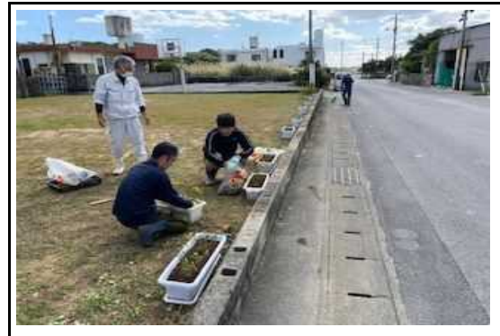
(美化活動 花いっぱい苗植え) 8