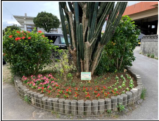
(苗花植え付け：みんなのガーデン)