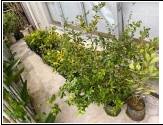
(美化活動 花いっぱい苗植え) 3