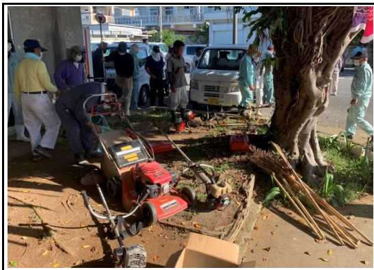
(美化活動：作業道具点検)