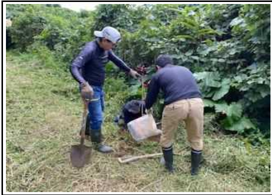
(美化活動 花いっぱい苗植え) 5