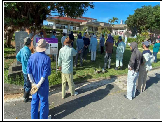
(美化活動：作業前点呼状況)