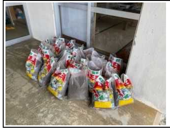
(美化活動 花いっぱい苗植え) 4