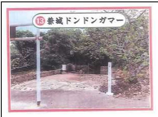
(拝所⑬：兼城ドンドンガマー) 施工後