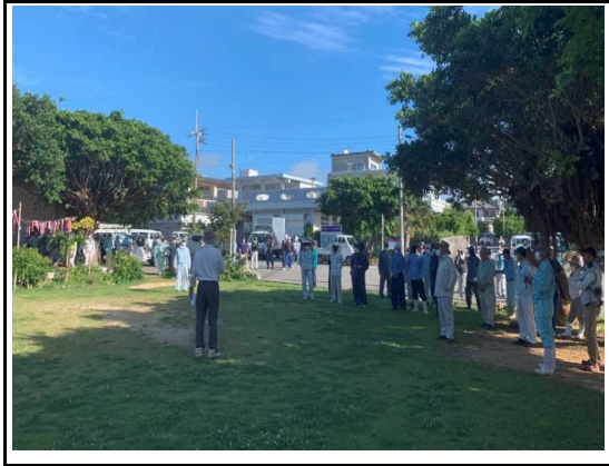
(美化活動：作業前点呼状況)