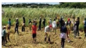
小学生の農業体験

沖縄県中山間地域ふるさと農村活性化基金の運用益等を活用し、地域リーダーの活動支援や人材育成、地域興しのPR活動等、中山間地域の活性化に向けた地域活動を支援するもので、平成6年度から実施している。