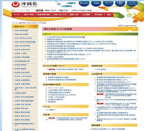
ウェブサイトによる広報