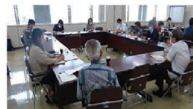
実践者による実績発表会