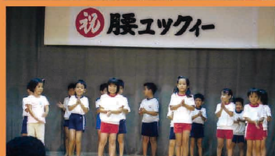
「守り繋ぐ結いの文化が活力のふるさとづくり」