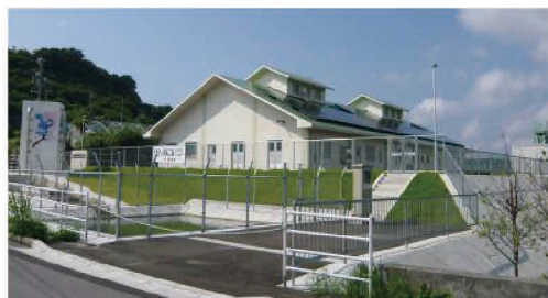
雄樋川地区(八重瀬町)