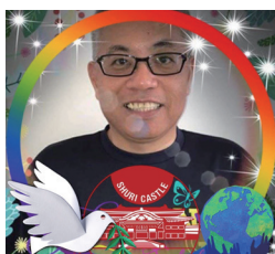
キンジョータカロー