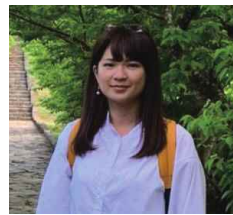
ちや 出身地：福岡県