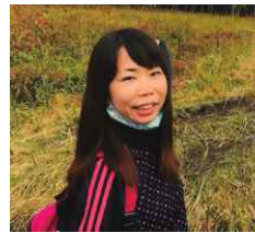
みーきー 出身地：宜野湾市