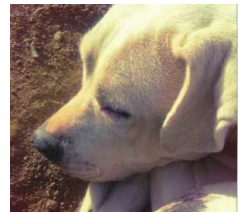
みわっち 出身地：宜野湾市