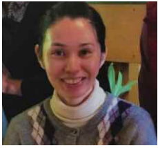
ゆかりんまる 出身地：南城市