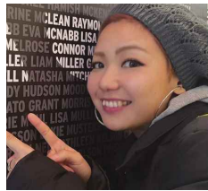
さき 出身地：豊見城市