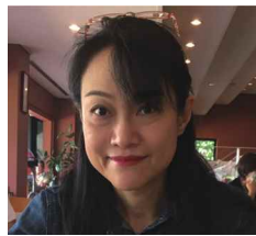
宮城 出身地：浦添市