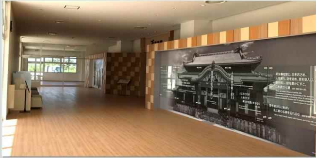
■ 展示エリア・エントランス