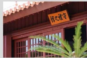
■ 特別道場からの眺望