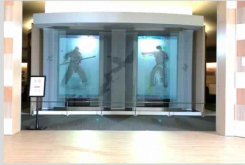
■ シンボルディスプレイ