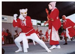
日向ひよっこ夏祭