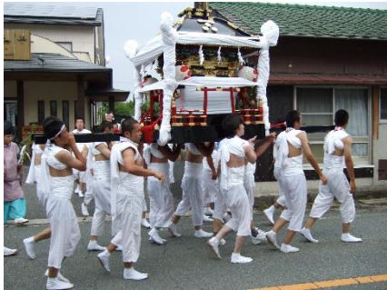
神輿の巡行：8月2・3日に巡行する。