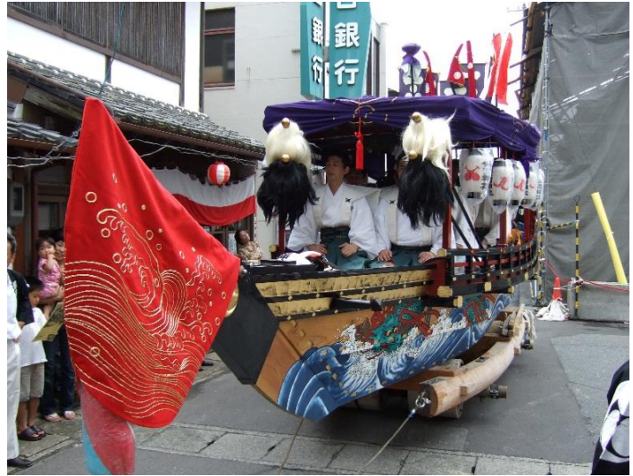
お船の巡行：8月3日の午後から深夜まで巡行する。

現在では、浜崎町内で引き受け、演唱者も選定し、「お船謡」を今日まで伝承しています。