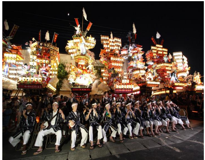
「豪華絢爛な『日田祇園山鉾集団顔見世』」

疫病や風水害を払う等、夏の厄除け祭りとして始まった祇園祭は、江戸時代より続いており、天領だった時代の栄華を彷彿させます。山鉾は九基あります。平成28年11月30日にユネスコ無形文化遺産「山・鉾・屋台行事」として登録されました。