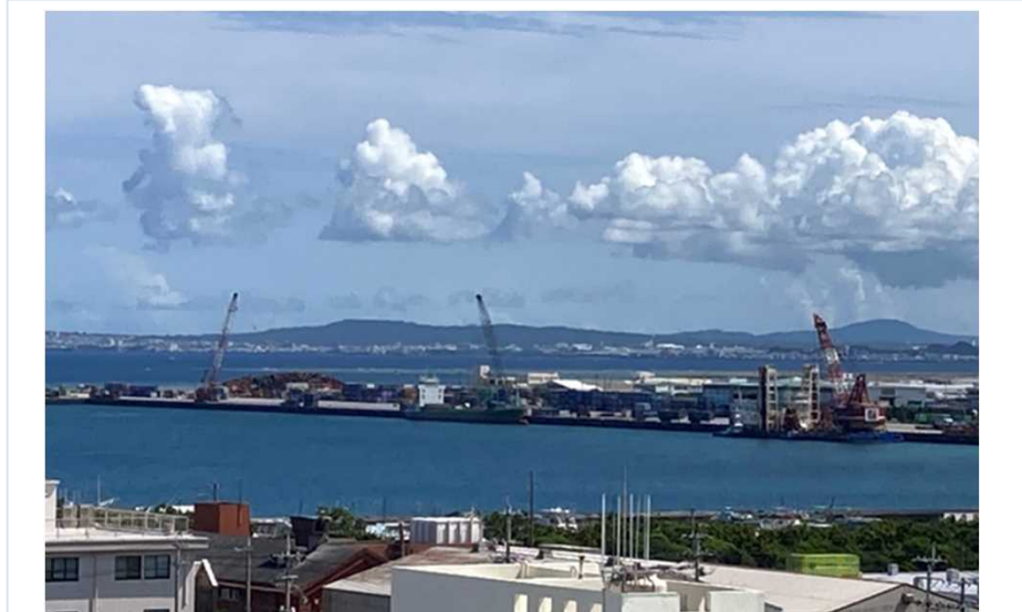
写真と関係するSDGsのゴールをはりつけよう