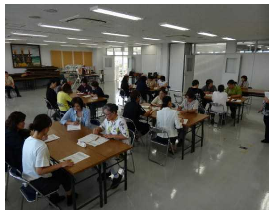
家庭教育支援者研修会