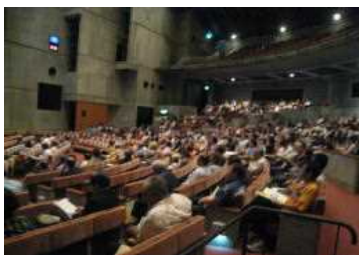
沖縄県公民館研究大会北部大会