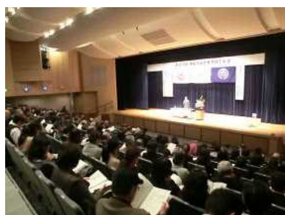
沖縄県社会教育研究大会