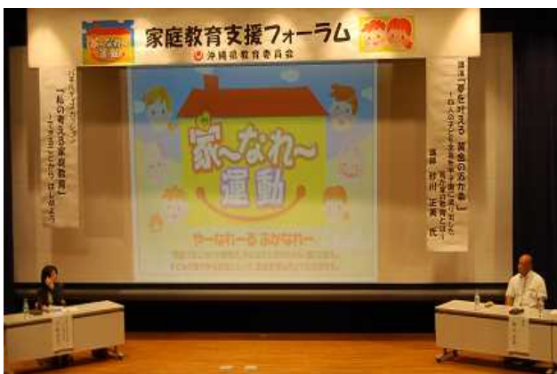
家庭教育支援フォーラム