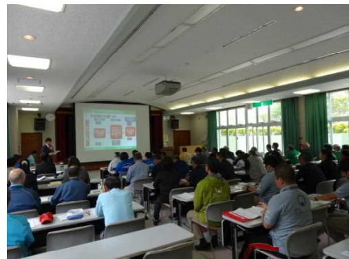
青少年教育施設職員研修会 (名護青少年の家)