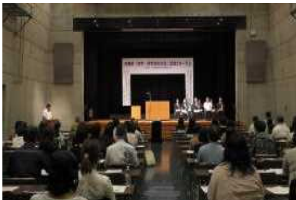
「文字・活字文化の日」記念フォーラム