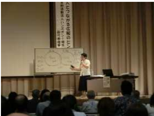
沖縄県社会教育指導者研修会