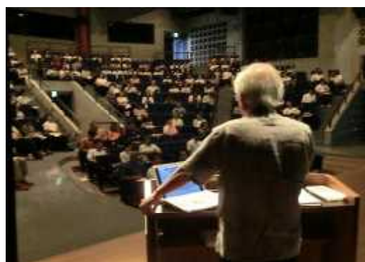
人権教育指導者研修会