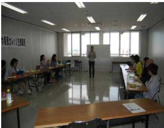
「地域限定通訳案内士入門講座」 （中頭教育事務所）