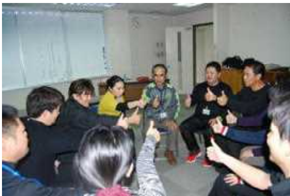
社会教育演習（レクリエーションの展開）