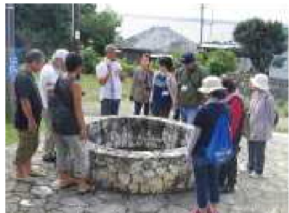
「四島マーイ」 （宮古教育事務所）