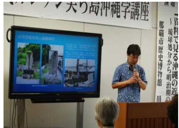
「ライブ配信中の講義風景」