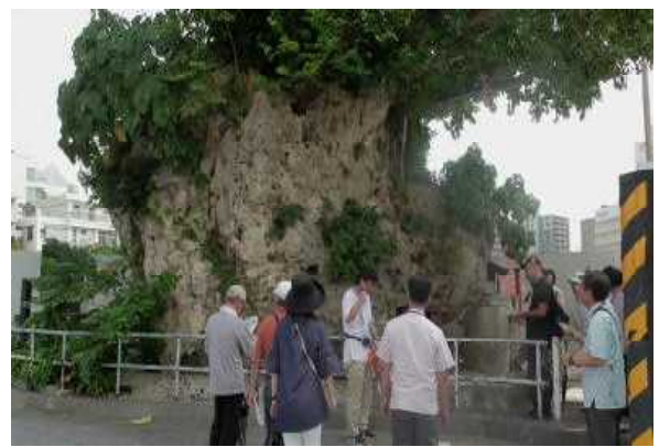
「フィールドワーク：仲島の巨石」