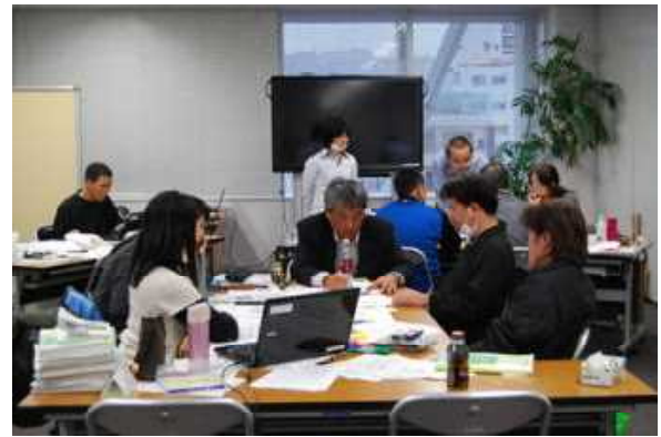
社会教育演習（事業計画立案の実際）