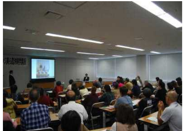
「ライブ会場での受講」 【講座⑥沖縄の年中行事と祭具・供物】