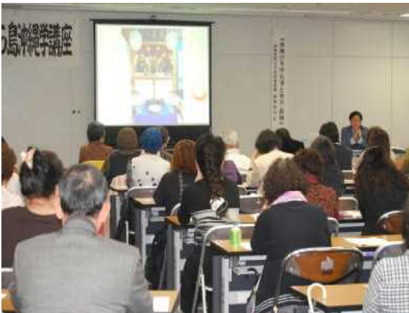
「ライブ会場での受講」 【講座⑤沖縄の年中行事と祭具・供物】