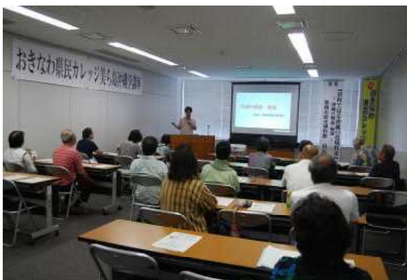
「ライブ会場での受講」