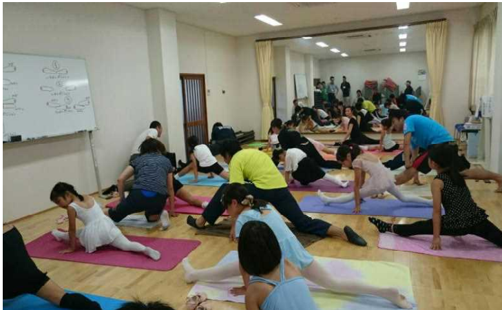
現地研修 公民館講座