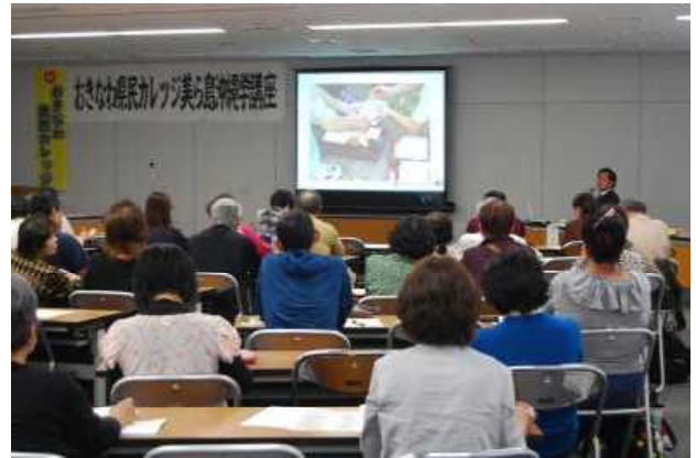
「ライブ会場での受講」 【講座⑤沖縄の年中行事と祭具・供物】