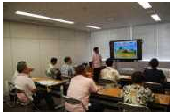
沖縄県社会教育主事専門講座 2