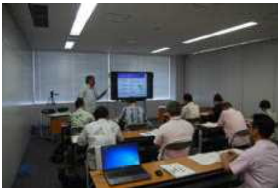
沖縄県社会教育主事専門講座 1