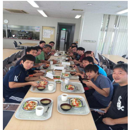
現地研修 長崎県 島原市