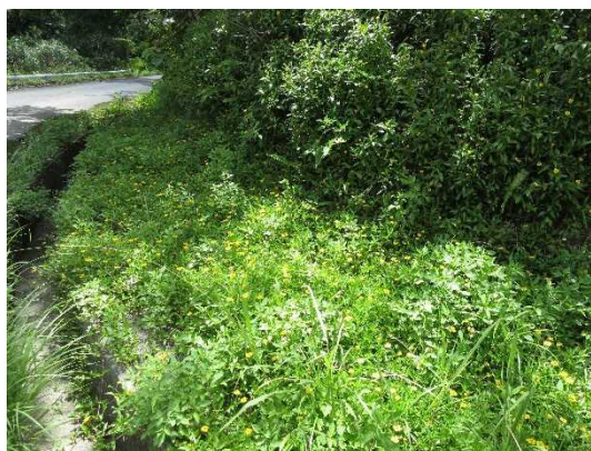
他の植物が生育できないほど繁茂する