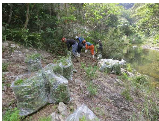
抜き取りながら袋につめていきます