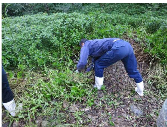
根・茎ごと引き抜きます

アメリカハマグルマは根や茎から再生するため、丁寧に株全体を引き抜くことが必要です。また、全体的な除去を行った後も取り残した根や茎から再生した株を定期的に抜き取るのが重要です。沖縄島での除去試験では、2ヶ月に一度の頻度で抜き取りを1年間行った結果、再生した株は見られなくなりました。