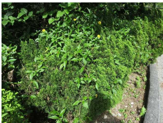
他の植物に覆いかぶさる

繁殖力が強く、他の植物の生育環境を奪って繁茂します。匍匐して伸びることから、他の植物に覆いかぶさることもあります。また、在来のハマグルマやキダチハマグルマとの交雑も心配されています。