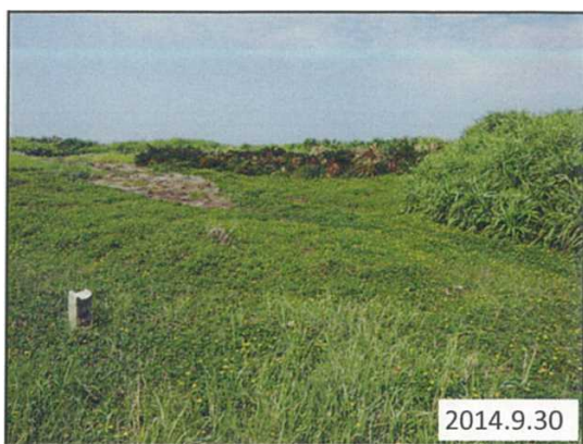
アメリカハマグルマが繁茂

この取り組みにより、翌年の4月にはシママンネングサやヤエヤマズコウジュが群落を形成するまでに再生しました。