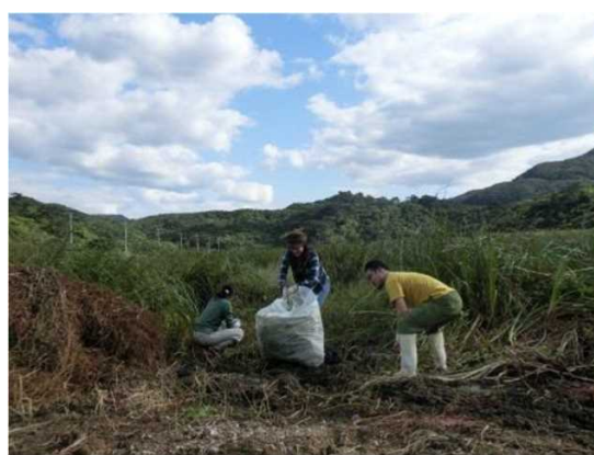
手作業による除去の様子