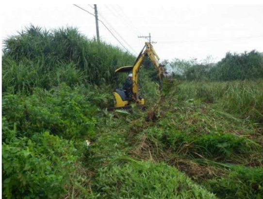
重機による除去の様子