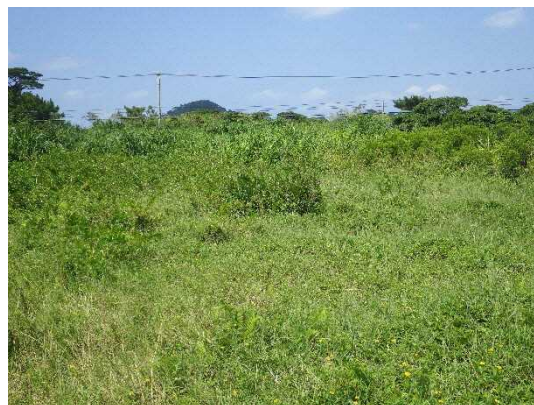
影響を受けやすい希少な在来植物の生育地の例（左：溪流 右：湿地）