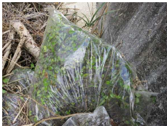
1 ヶ月後に地中の根・茎から再生した株 ビニール袋に入れて2 ヶ月後の様子