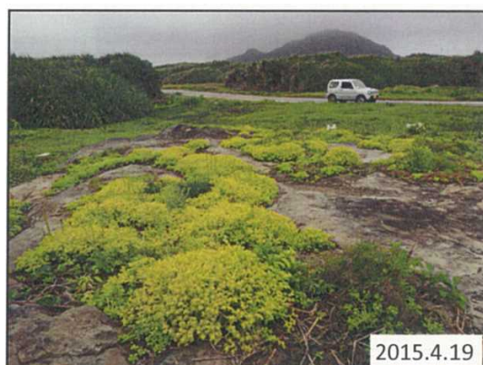
シママンネングサが再生