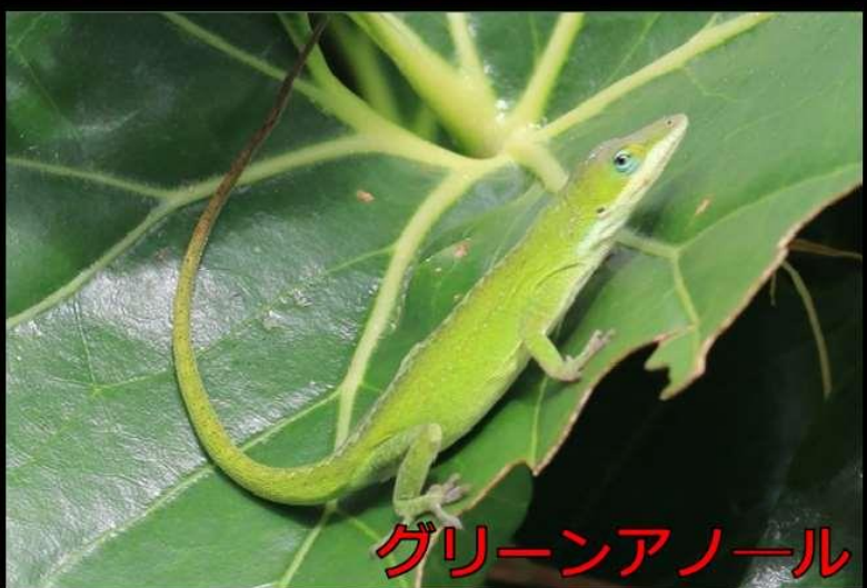
グリーンアノール