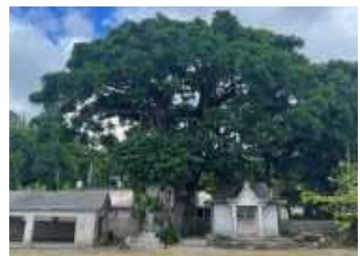
R5認定 / 浜元のアンマーフチュルガジュマル 本部町