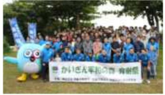
かいぎん平和の森育樹祭 (R4)