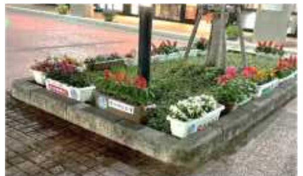
アウトレットモールあしびなー（R4状況）