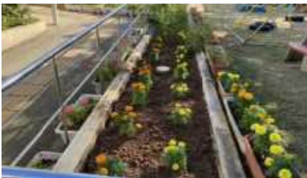
① 今帰仁村 緑化推進事業