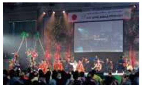
記念式典の様子（メインアトラクション）