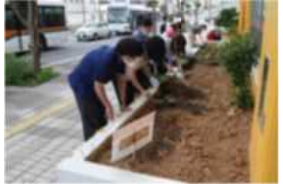
コザ・ミュージックタウン周辺の花壇美化