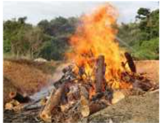
伐倒駆除（焼却）の様子