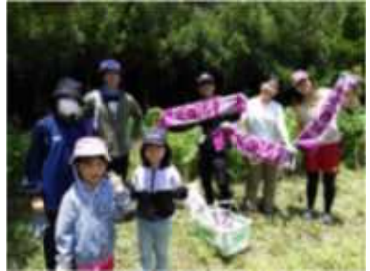
首里城公園友の会育樹祭