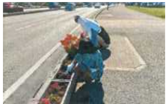
② うるま市 緑化推進事業