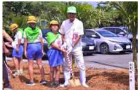
ヤーバルやすらぎの森