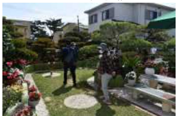
オープンガーデン