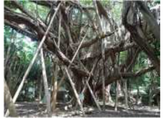
浜区シヌグ堂ガジュマル