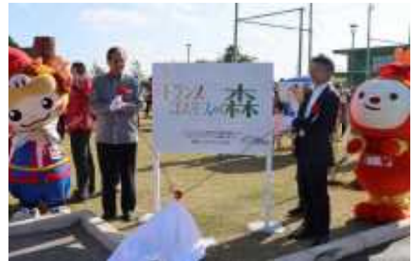
八重瀬町スポーツ観光交流施設での植樹祭