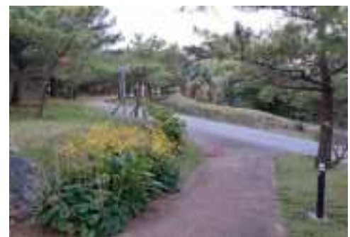
R5認定 / 上の毛（ウィーヌモー） 那覇市