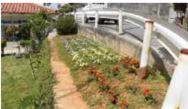
③ 浦添市 都市緑化推進運動