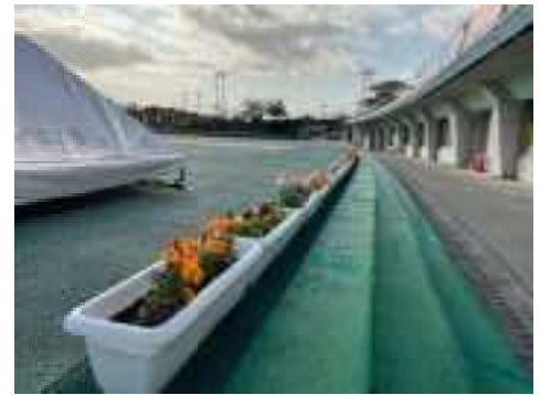
黄金森陸上競技場