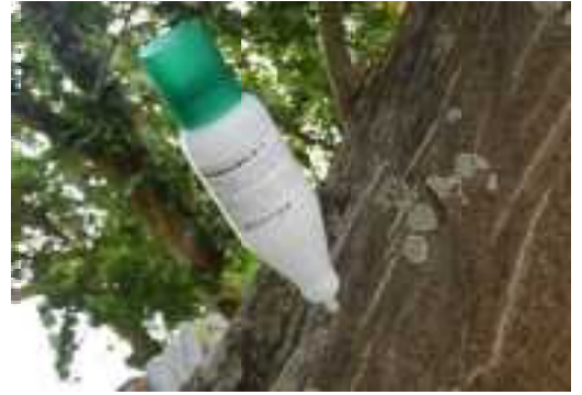
デイゴの防除対策の様子