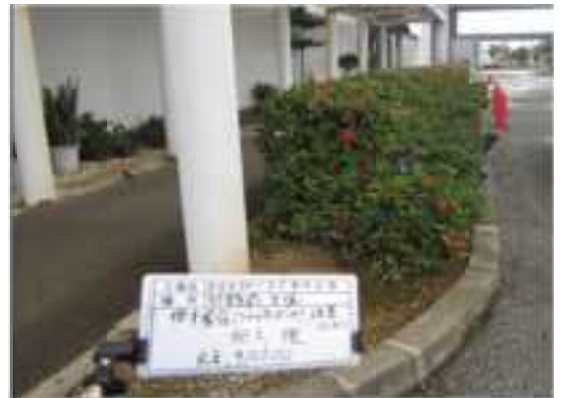
既存緑地の維持管理（本店）