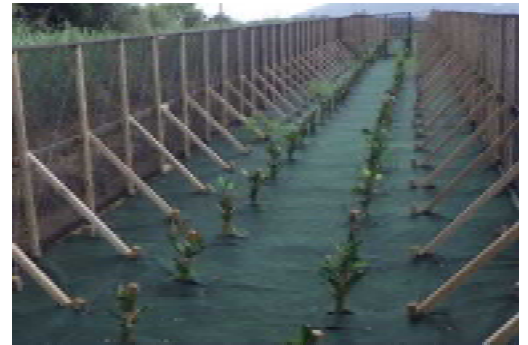
石垣市・みやらがわ第6地区