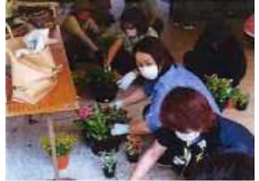
寄せ植え講習会（南風原町女性会）