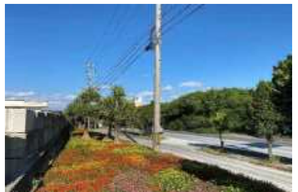
国道390号平良親里線