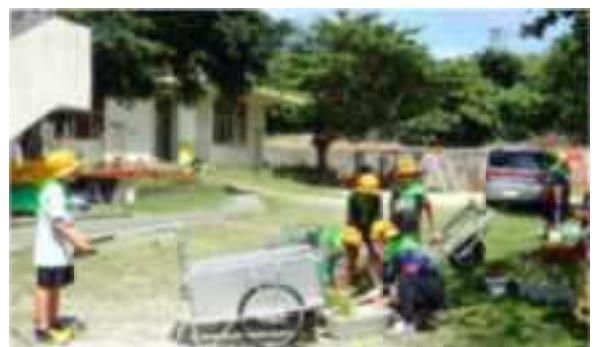
④ 与那国町 緑の少年団による緑化活動