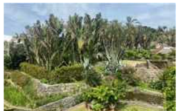
R5認証 / 海洋博覧会地区内施設(美ら島財団)