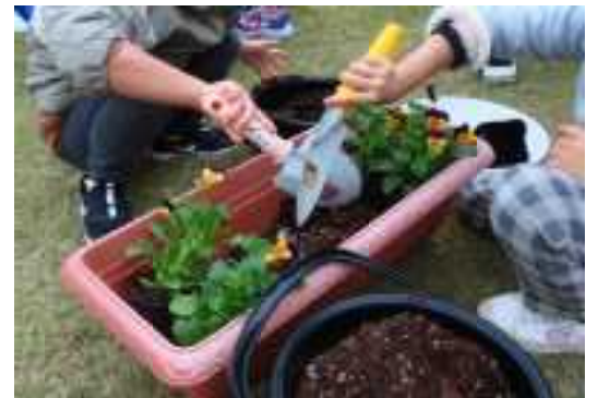
チューリップ植付体験の様子