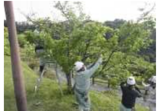
名護さくらのまち推進事業