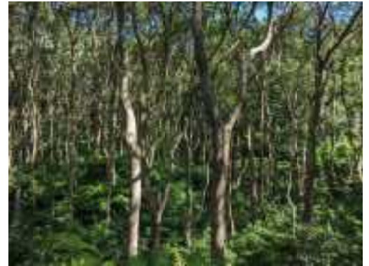
今帰仁村・単層林整備