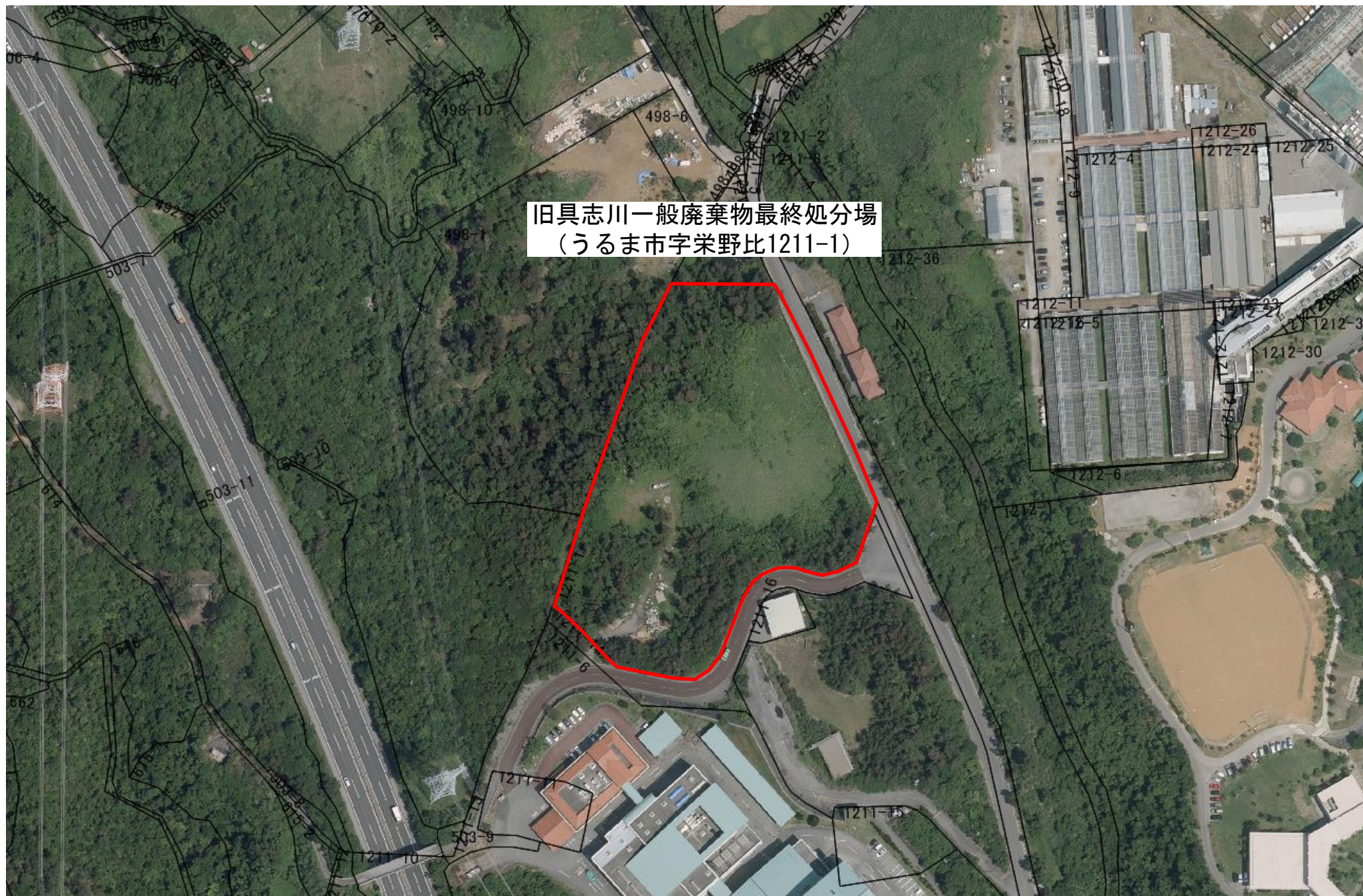
地積併合図（地積図+航空写真）