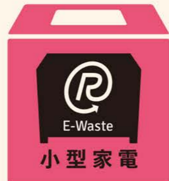
このマークが小型家電回収の目印です

市役所などの公共施設、またはスーパー、家電量販などの小売店に、回収ボックスが設置されている市区町村もあります。ごみ回収の区分に「小型家電」がある市区町村もあります。詳しくはお住まいの市区町村にお尋ねください。