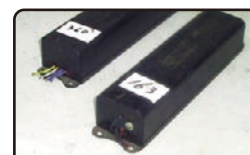
業務用・施設用蛍光灯の安定器